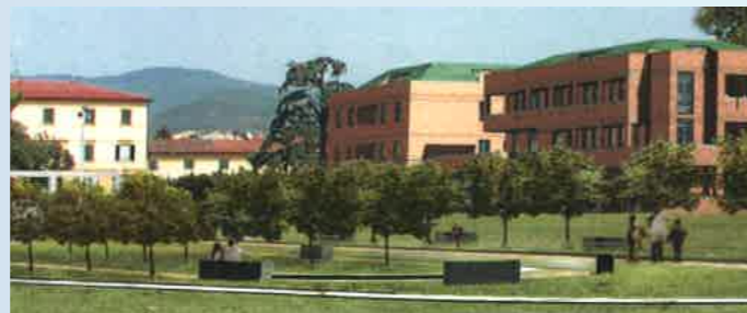
L'area della nuova sede di Via Bonellina con il progetto della Cittadella della Solidarietà

Oggi la Misericordia di Pistoia è una realtà importante presente sull'intero territorio provinciale con 21 Confraternite ad essa collegate.